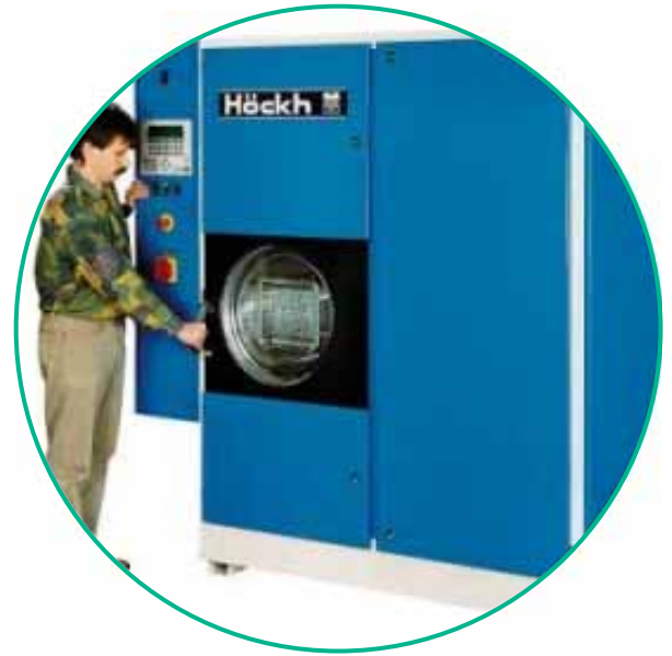
MULTICLEAN-O-3-F manuell beschickt

Die MULTICLEAN-1-3-F ist konzipiert für Anwender mit hohen Anforderungen an die Fettfreiheit und vollautomatische Betriebsweise bei kleinen Warenkörben.